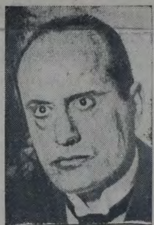
MUSSOLINI, QUE QUISIERA PONER bajo la tiranía fascista a los argentinos hijos de italianos.

Actitud hostil de Mussolini. Peligro de ir a parar a un cuartel fascista SIN SOLUCION